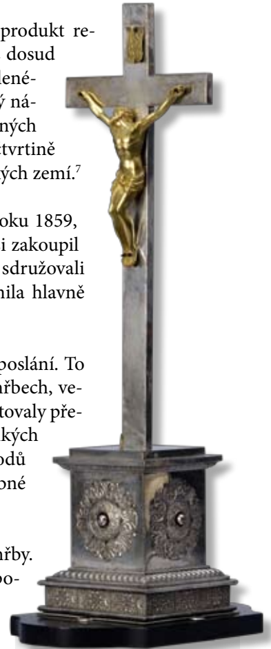
Postříbřený kříž na rakev, 19. století

V době baroka byla rakev doslova obtěžkána výzdobou. Pozlacené či postříbřené kříže s bohatě zdobenými sochami zdaleka zářily v kontrastu černé barvy příkrovu a pohřebních štítů.