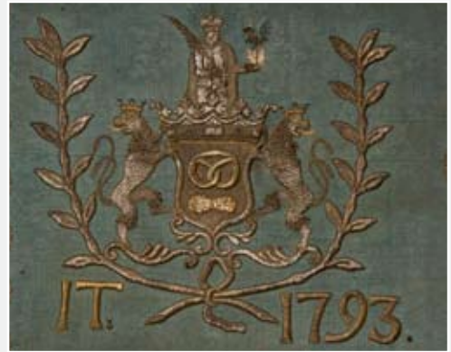
Výřez korouhve brandýského cechu pekařů, 1793

Zásadní změny nastaly v první polovině 18. století, kdy stát omezil monopolní postavení cechů v řemeslné výrobě a jejich samosprávu. Už na přelomu 17. a 18. století docházelo v habsburské monarchii k prvním soustavnějším pokusům o úpravu některých hospodářských poměrů státem. S těmito potřebami úzce souvisela ekonomická situace měst po třicetileté válce, problém mimocechovního podnikání a pronikání kapitalistických prvků na venkov formou tzv. rozptýlené manufaktury a nákladnického systému. Návrhy na řešení hospodářské situace habsburských zemí byly ovlivněny tzv. merkantilismem, učením, které usilovalo o hromadění obchodního kapitálu uvnitř státu, k čemuž měla nápomoci podpora vývozu a budování domácích manufaktur. Do zorného pole merkantilistů se tak zákonitě dostaly cechy jako tradiční organizace sdružující