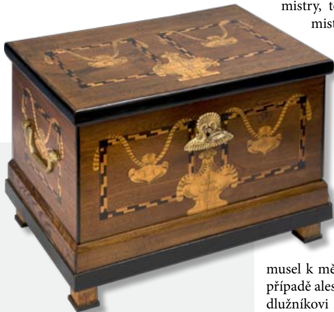
Cechovní pokladna z roku 1826

Dřevěná pokladna zdobená intarzií, doplněná jménem inspektora a monogramy cechmistrů.