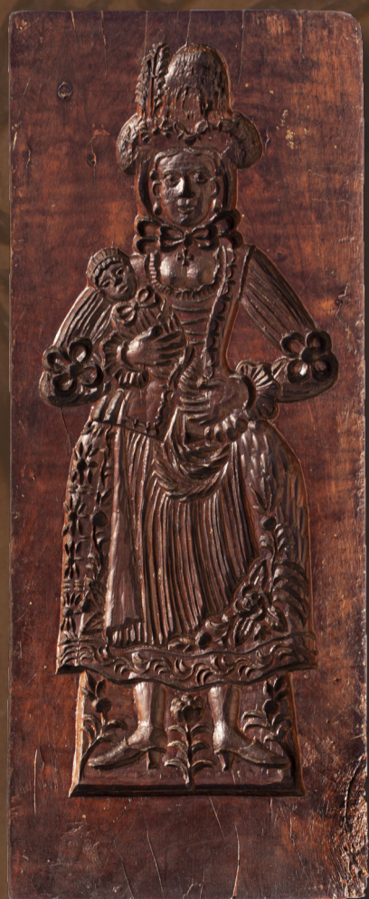
Selka s miminkem, 1774 nejstarší forma v muzeu

Formy se vyřezávaly do 3-5 cm silných desek z tvrdého dřeva. Nejvhodnější bylo dřevo ovocných stromů , například hrušně, třešně, švestky, ale i ořechu nebo zimostrázu.