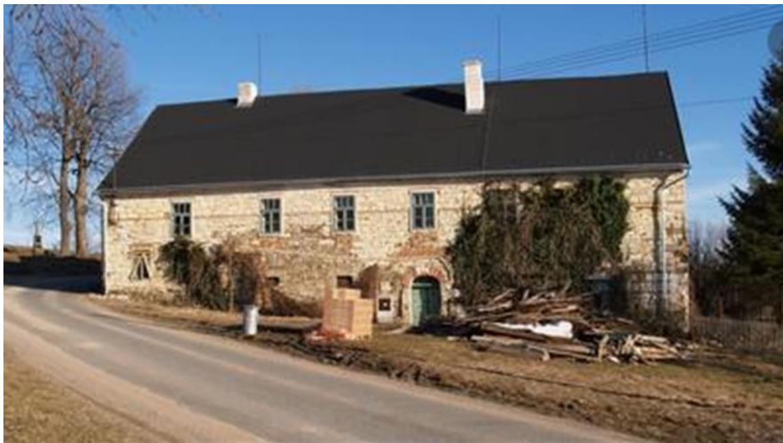
Onen pověstný Librův grunt v Nedvěži 82